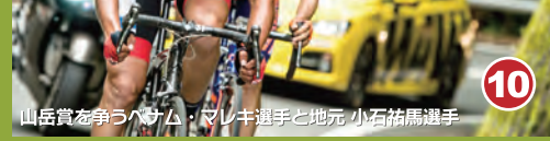
10 山岳賞を争う選手たち。初し生選手と地元小石川組選手