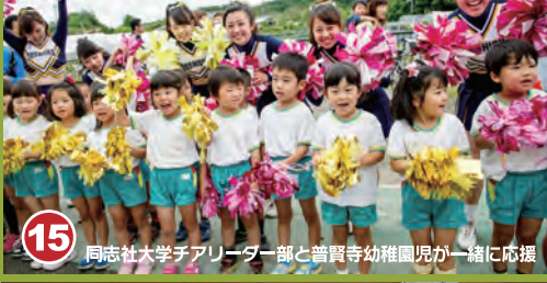
15 同志社大学アリーナ館と普賢寺幼稚園児が一緒に応援