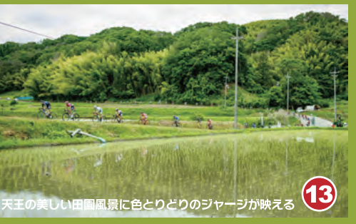
13 天王の美しい田園風景に色とりどりのジャージが映える