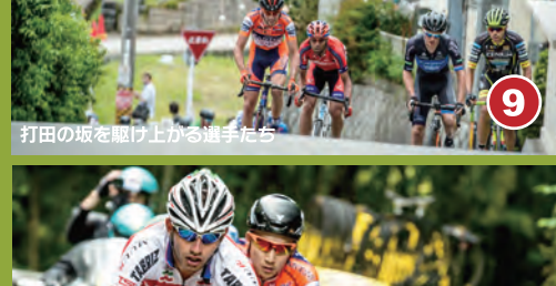
9 打田の坂を駆け上がる選手たち