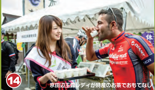
14 京田辺市「メディア」の特産のお茶でおもてなし