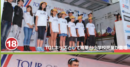
18 TOJキッズとして精華町小学校児童が活躍