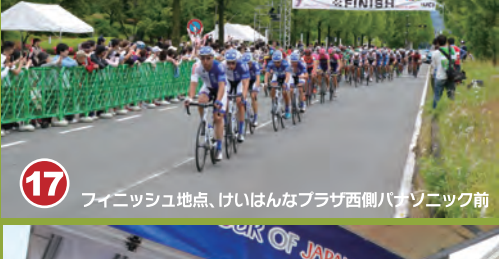
17 フィニッシュ地点、けいはんなプラザ西側パナソニック前