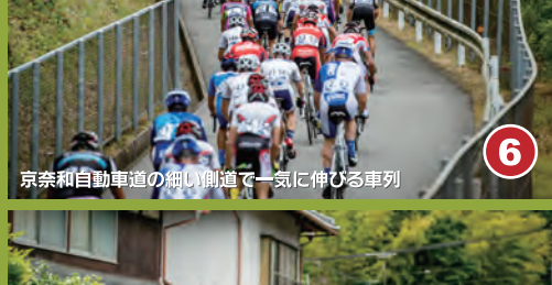
6 京奈和自動車道の鳥飼峠で一気に伸びる車列