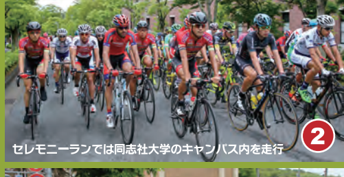
2 セレモニーランでは同志社大学のキャンパス内を走行