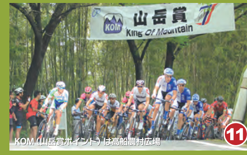
11 KOM(山岳賞ポイント)は高船バス停付近