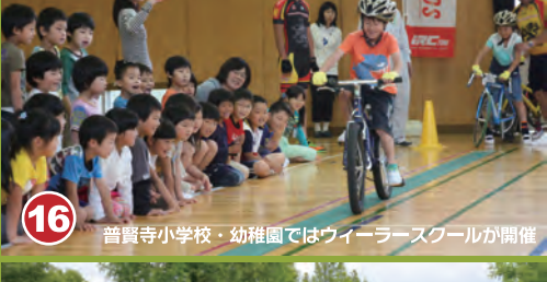
16 普賢寺小学校・幼稚園ではウィーラースクールが開催