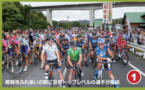
1 普賢寺ふれあいの駅に世界トップレベルの選手が集結