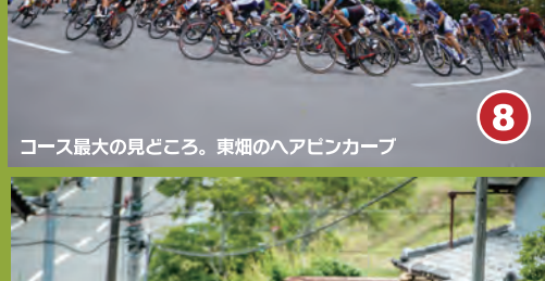
8 コース最大の見どころ。東郷のヘアピンカーブ