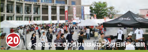
20 多くの市民でにぎわったけいはんなプラザ日頃の応援