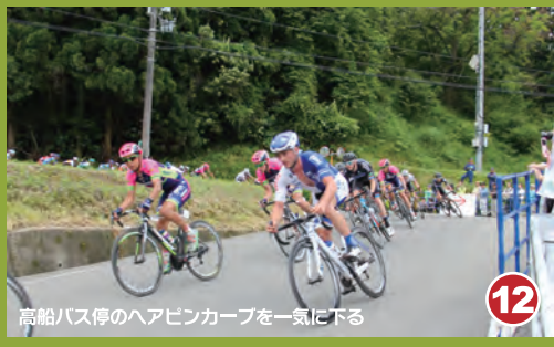
12 高船バス停のヘアピンカーブを一気に下る