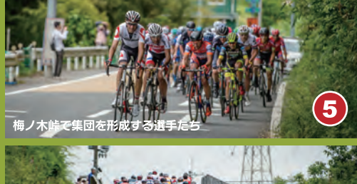
5 梅ノ木峠で集団を形成する選手たち