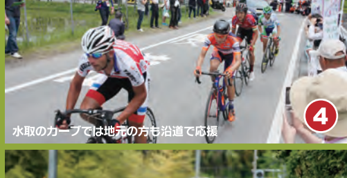
4 水取のカーブでは地元の方々が応援を飛ばす