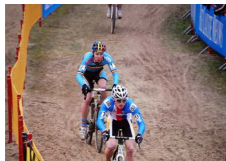
シクロクロス・レース(イメージ)