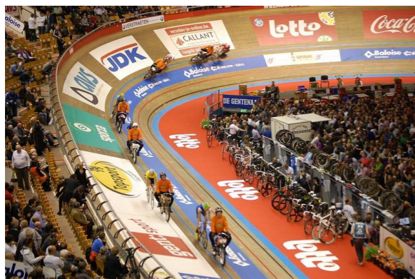
アントワープ6日間レースの会場にて(イメージ)