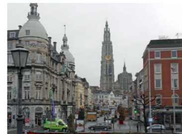
アントワープ市内(ノートルダム大聖堂)

当ツアーは参加人数が4名から出発の受注型企画旅行となります。2日目から7日目の行程については他の参加者との混載ツアー(最大6名)となります。上記旅行代金は2013年6月時点の航空座席の空席状況にもどづく参考料金となります。詳しくはユーラシア旅行社(TEL03-3265-1900/担当:栗山)までお問合せ下さい。